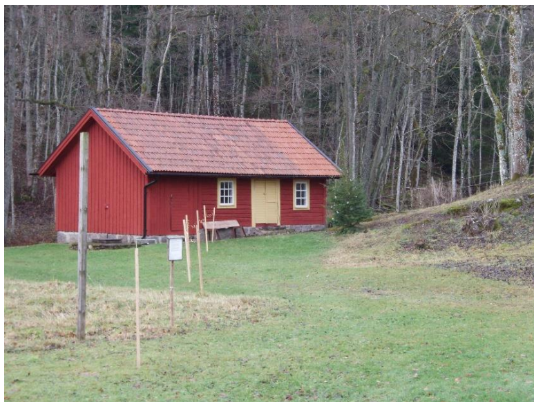
Det renoverade svinhuset