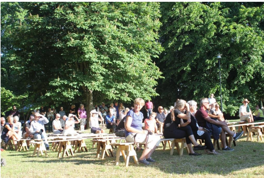
John Bauer-dagen 4 juni