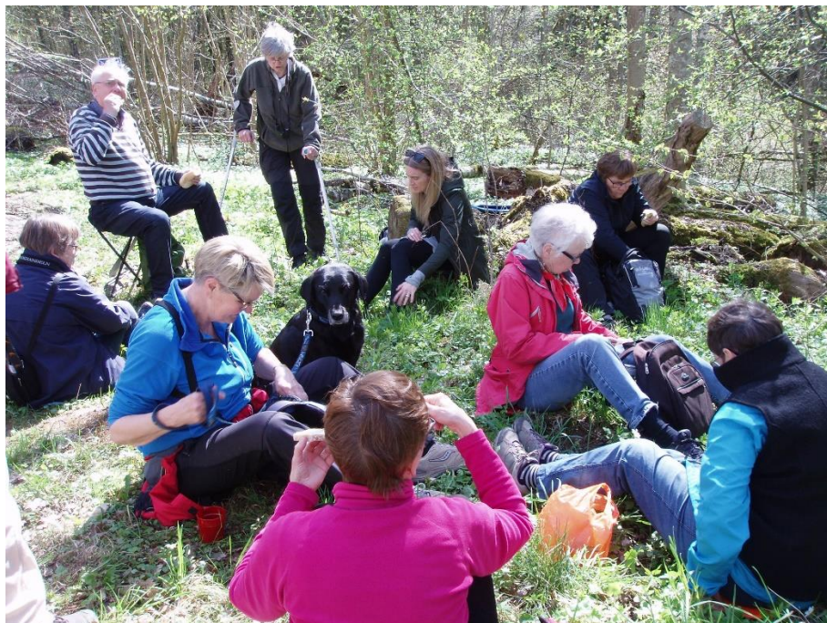
Fikapaus under vandringen på Strömsbergs gård

Naturvårdsgruppen har medverkat i genomförandet av ett anta exkursioner: Vinterfågelvandring tillsammans med Fågelklubben, Strömsberg – natur och kultur tillsammans med Strömsbergsföreningen och fjärilsvandring vid bergets fot i Taberg under den Biologiska Mångfaldens Dag