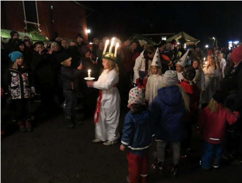
Julmarknadens Lucia på Strömsbergs gård.

Gott om både försäljare och besökare på den gemytliga julmarknaden, trots snöbrist och långa köer. Naturskyddsföreningen var på plats i magasinet, som trots farhågorna kunde användas ännu en gång. Vi sålde mest av pussel, kort och lokalproducerad honung. Kanske sista julmarknaden. Magasinet ska användas till annat.