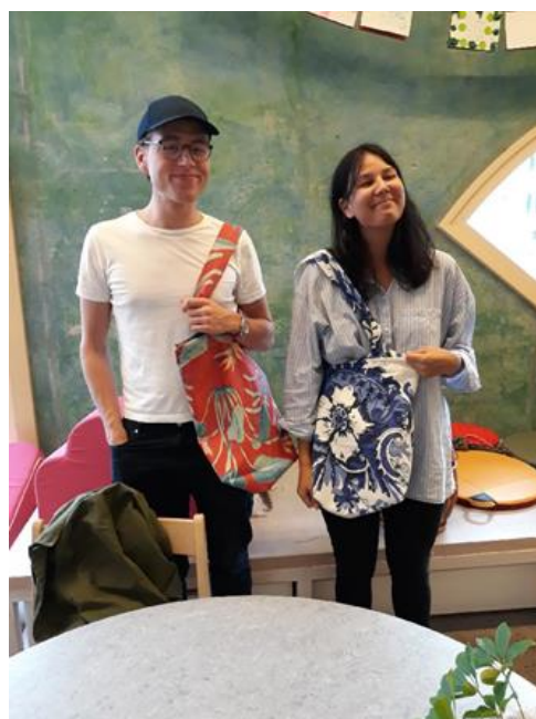
Tygkassar av en gardin och en duk.