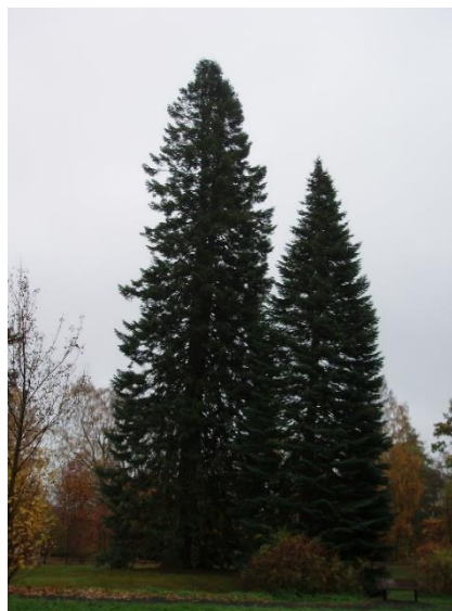
Coloradogranen i stadsparken

Medlemmar har under året hört av sig och ställt frågor om djur och natur, och i ett par fall uttryckt önskemål om att kretsen agerar i en viss fråga. Under sommaren kom flera samtal, mejl och Facebookkontakter om skadade fåglar i olika utemiljöer. Det finns tyvärr inte så mycket att göra i sådana fall, utan att låta naturen ha sin gång. Hur grymt det än kan låta är det mest barmhärtiga att avliva fågeln. Trädfällning i Vattenledningsparken har också orsakat flera upprörda telefonsamtal. Det finns också ett latent hot för de skyddsvärda tallarna vid entrén till Stadsparksvallen liksom mot landets näst största gran på norra sidan av arenan. Coloradogranen som mäter 569 cm i omkrets och är 43 meter hög är planterad i slutet av 1800-talet i det arboretum som finns i backen upp till parken. En utvidgning och ombyggnad av fotbollsarenan finns med bland de alternativa förslag som diskuteras för att få en moderna arena för fotbollsspel.