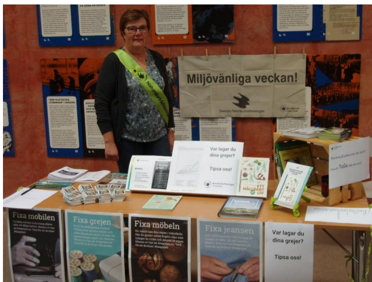
Vi fick in en del tips på var man kan laga grejer.