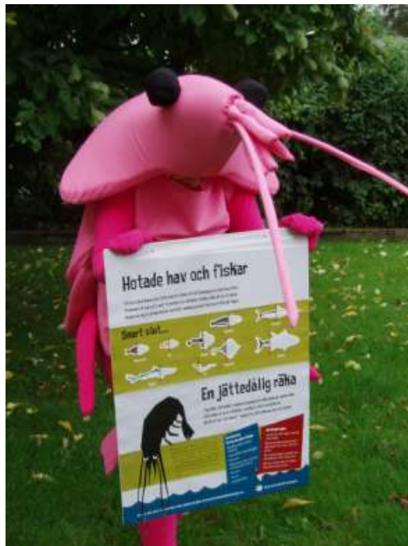
Jättedålig jätteräka som inte vill bli uppäten