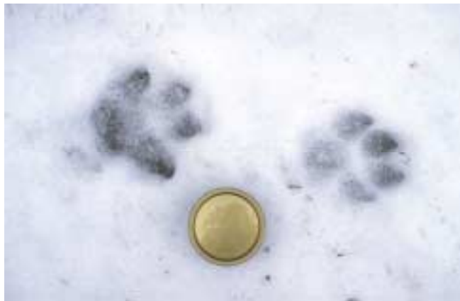
Vargspår och snus i Värmland