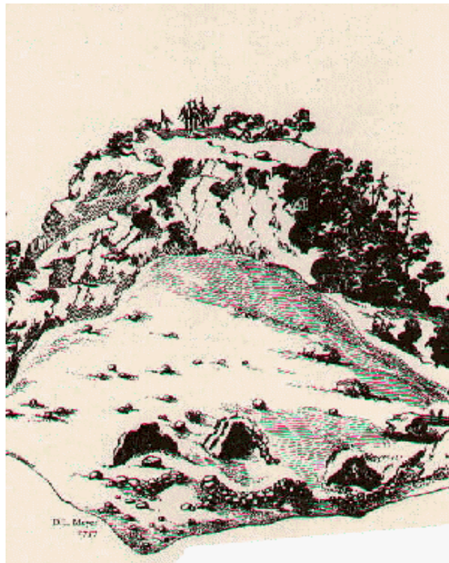
Bild på Taberg år 1757